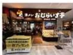
山口ゆめタウン下松店