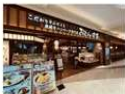
兵庫イオン明石店