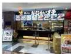
広島ゆめタウン東広島店